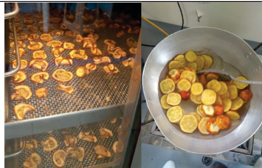
Desarrollo de frutales amazónicos osmodeshidratados