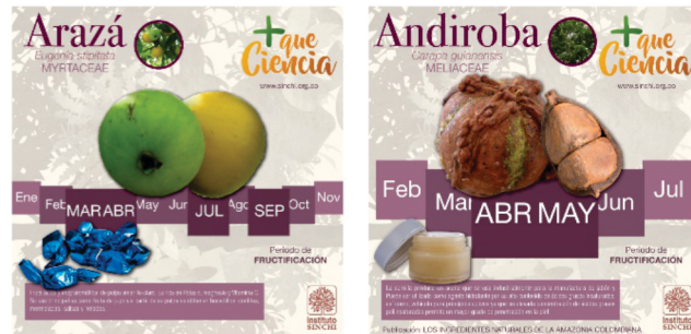
Fichas de especies amazónicas, en campañas de difusión de sus propiedades, usos y productos elaborados por los emprendimientos (se elaboraron 11 fichas con la oficina de comunicaciones del Instituto)