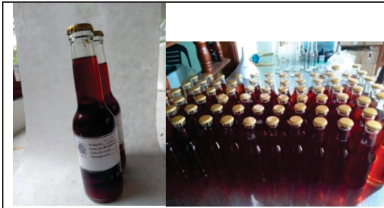
Cerveza de frutos amazónicos. Producto desarrollado y transferido.