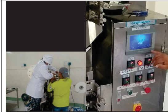
Apoyo en formación de pasantes SENA e instalación de maquinaria